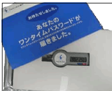
トークン & ワンタイムパスワード