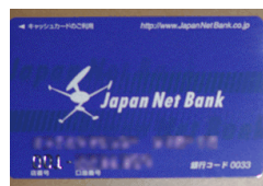
キャッシュカード